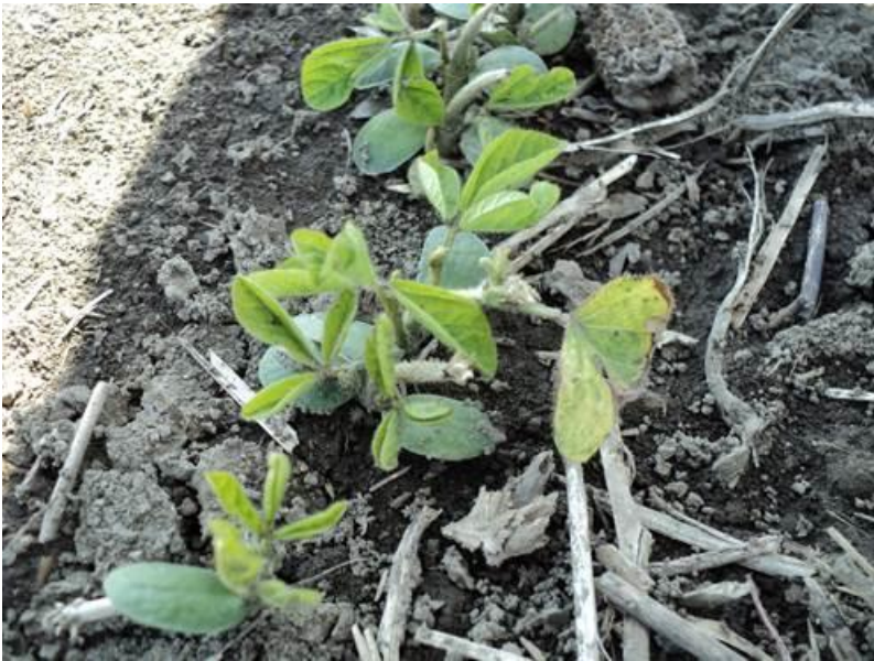
Le même champ vu cette semaine. Bonne reprise, tallage.