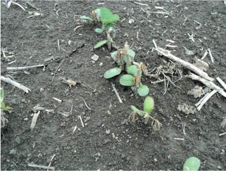
Aperçu des dommages par le gel de la fin mai sur le soya.

Vous trouverez ci-dessous une revue des dernières semaines (du plus ancien au plus récent) que nous avons mis sur le Facebook de COGENOR. Pour ceux et celles qui ne sont pas sur Facebook ou qui n'y sont pas à l'aise, vous pourrez ainsi avoir un aperçu. La légende se trouve sous la photo ou le lien hypertexte.